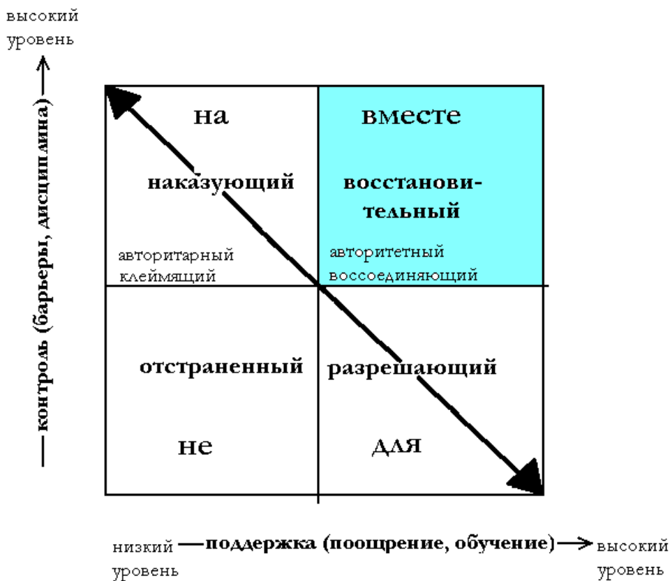
Рисунок 2. Окно социального контроля.

главных подхода к социальному контролю: отстраненный, разрешающий, наказующий и восстановительный.